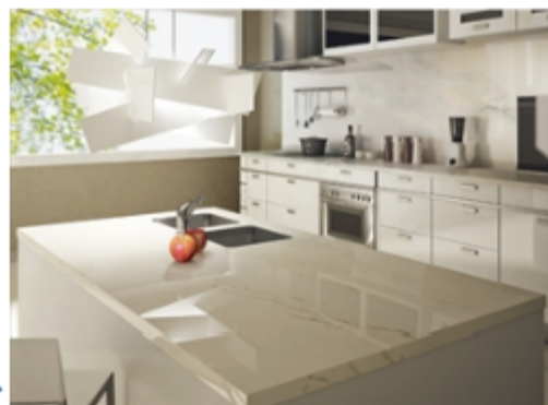
Marmi MAXFINE (マルミ マックスファイン) →

厚さ6mmという薄さで加工がしやすく、大板でシームレスに近い施工が可能となります。そのため、内装仕上げ材だけでなく、カウンター天板、パーテーション仕上げ等様々な用途で使用できます。