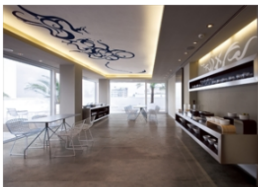
↑ ROADS MAXFINE (ローズ マックスファイン)

テクノロジーストーンの製造技術の進化によって、厚さ6mmという薄さで最大3000×1500mmという超大板セラミックタイル「MAXFINE (マックスファイン)」が誕生しました。 中まで施された多彩な色合いを持つ柄と天然大理石を上回る性能を合わせ持つ「Marmi MAXFINE (マルミ マックスファイン)」が新たにラインアップしました。大板のため目地が少なく、一般サイズのタイルでは実現できなかったシームレスに近い石目模様で迫力のある空間を創り出すことができます。