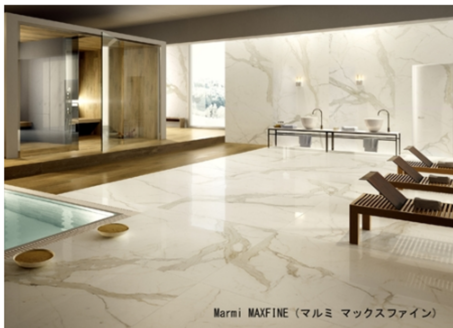
Marmi MAXFINE (マルミ マックスファイン)

厚さ6mmという薄さで最大3000×1500mmという 超大板セラミックタイル「MAXFINE (マックスファイン)」を新発売しました。