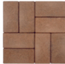
スパイシーブラウン