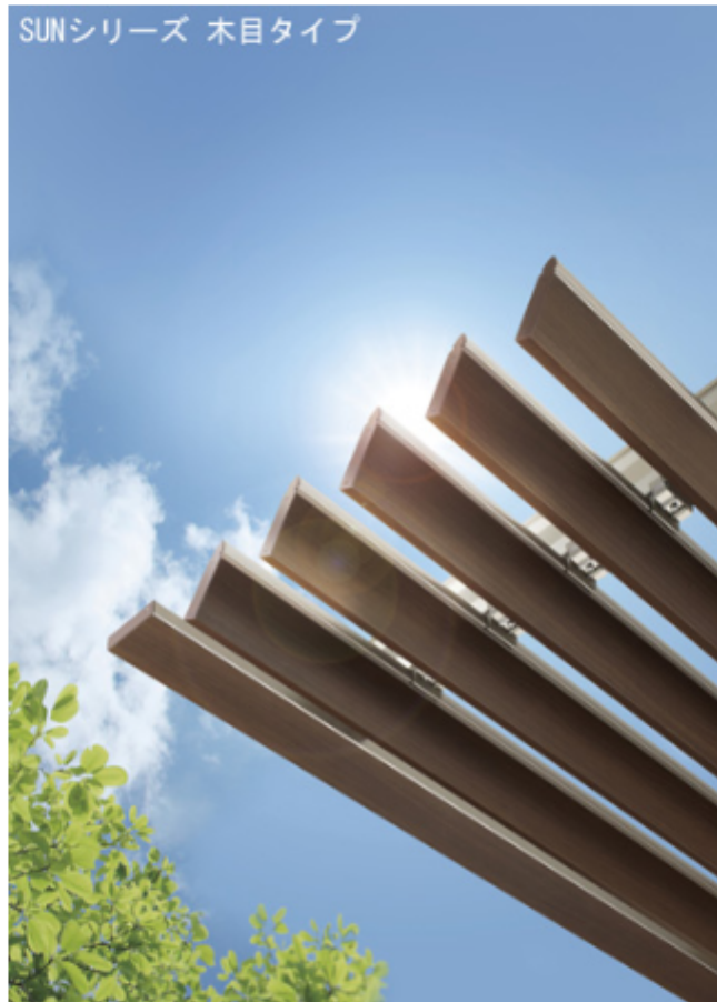
SUNシリーズ 木目タイプ

建物の表情をデザインする庇、インターハイザーの「SUNシリーズ」と 「CANシリーズ アームレスタイプ」に「木目タイプ」を追加し新発売しました。