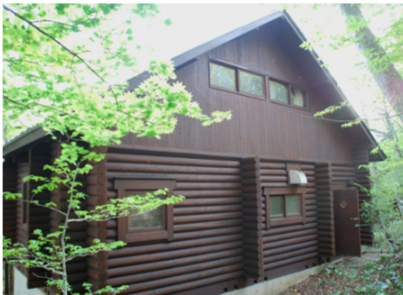
浸透性木材保護着色塗料「ランバージュ」を新発売しました。