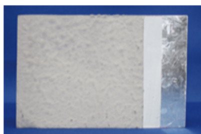
表面にインサルキソッシュを塗布した鉄板

基礎クラックが発生した場合でも上塗り材の弾性モルタルが追従するため、表面にクラックが入りません。