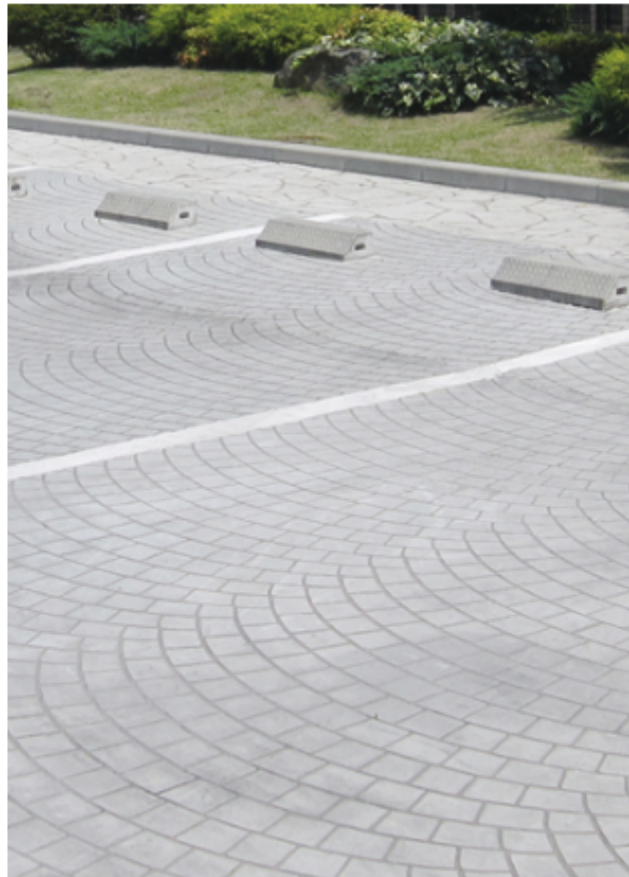
屋内外の既設コンクリートへの改修用途としても施工できる 無機系速硬性薄層ペーストデザイン床（塗付タイプ） 「デザインクリートビジュアルPT」を新発売しました。