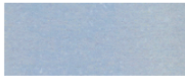
【プラントリペア 錆止めスーパーT54】 (膜厚：約120μm) わずかな白錆(亜鉛の白化)のみ