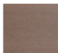
ダーク (フラット) 受注生産