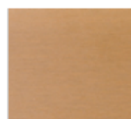
アンバー (フラット) 受注生産