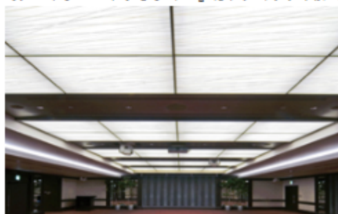
オリジナル模様で都会的な演出をした一例。