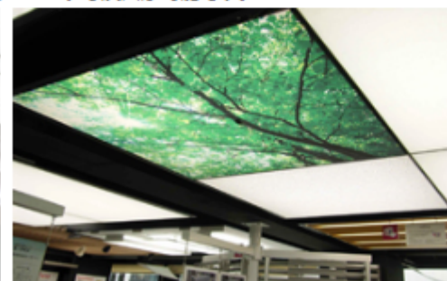
写真を使った落ち着きある空間演出の一例。