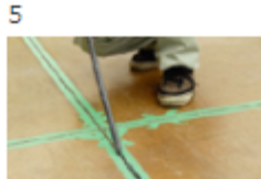
5 クイックシール充填