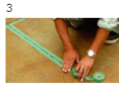
3 目地廻りのマスキングテープ養生