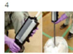
4 本体をガンにセットする 最初の10ccを捨てる (最初の材料が出てから 5回以上噴出する)