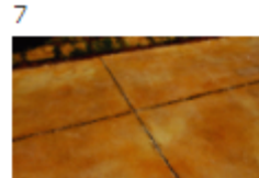
7 直ちに養生材撤去・解放