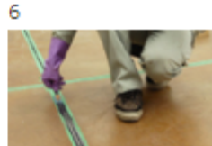
6 充填直後にヘラ押さえ