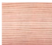
サンパイン桎(まさめ)