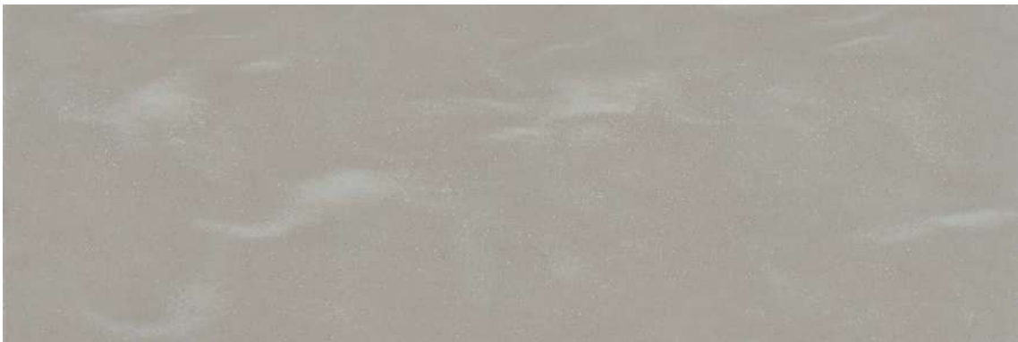
全体イメージ(500×1500mm / 縮尺 約1/10)