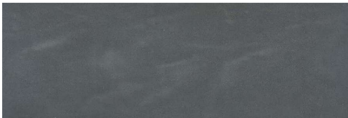
全体イメージ(500×1500mm / 縮尺 約1/10)