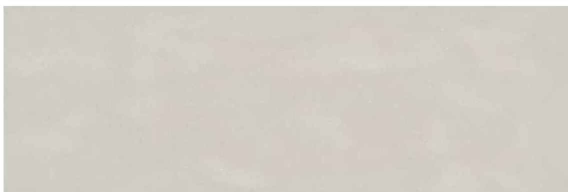
全体イメージ(500×1500mm / 縮尺 約1/10)