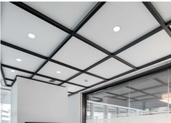
ホワイト/ブラック