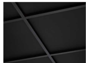
ブラック/クラシカルオーク