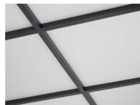
ホワイト/クラシカルオーク