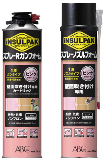
スプレーR ガンフォーム スプレーノズルフォーム