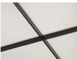
ホワイト×ブラック