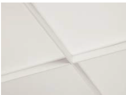
ホワイト×ホワイト