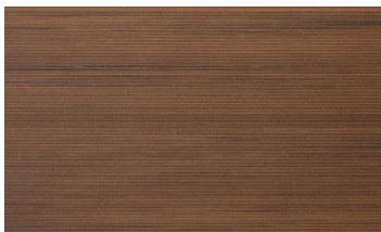
ウォールナットブラウン