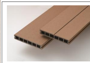
<参考>一般的な人工木デッキ材