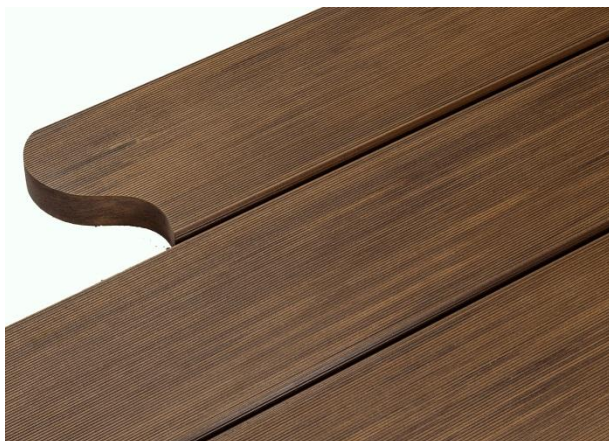
アースデッキ®ソリッドグレイン

一般的な多くの人工木デッキ材は押出成型品であり断面が中空となるため、Rカットや切り欠きなどの複雑なカットを行うことができませんでした。一方、「アースデッキ®ソリッドグレイン」は押出成型品でありながら無垢材であるため、天然木デッキ材と同じように複雑なカットが可能となり、中空部への水や虫などの侵入を防ぐことができます。また特殊技術により、デッキ表面には木目流れ模様を施し、単調ではない木肌感をリアルに表現しています。中空材と比較し角欠けや適度な衝撃にも耐え、重歩行部や階段踏面などに適し、トゲやささくれがなく素足での歩行が可能です。